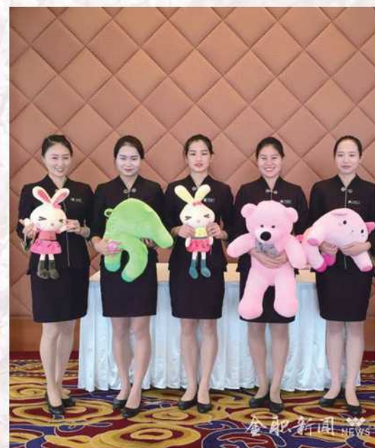
我校酒店管理专业学生于北京饭店参与“两会”服务工作

今年已是我校旅游学子第7次参与“两会”接待服务工作，学院于2012年与北京饭店建立了紧密的校企合作关系，每年输送10-20余名实习生，进行为期10个月的教学顶岗实习，每届实习生都能有幸参与到“两会”接待服务工作中去，大家高水平的服务一直饱受好评。